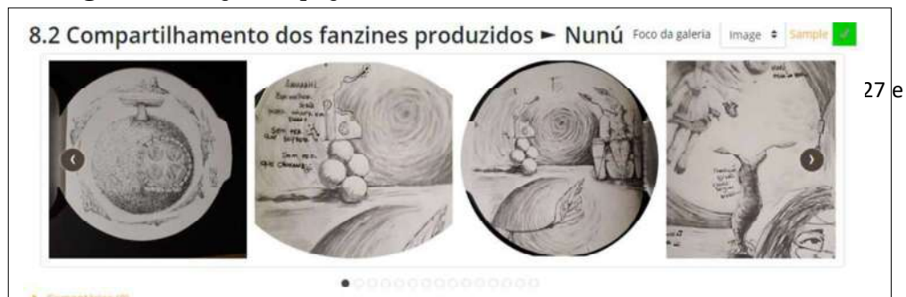
Figura 9 – Algumas páginas do do fanzine final “Nunú” de Júlia Di D. Pupim