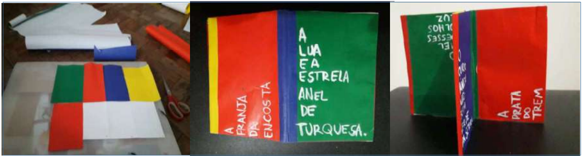
Figuras 3 a 5: Amostras de um minizine elaborado de 8 pág. inserido na Tarefa 4/Tópico 6.2.

Fontes: minizine da aluna Julia Di D. Pupim. Disponível em: