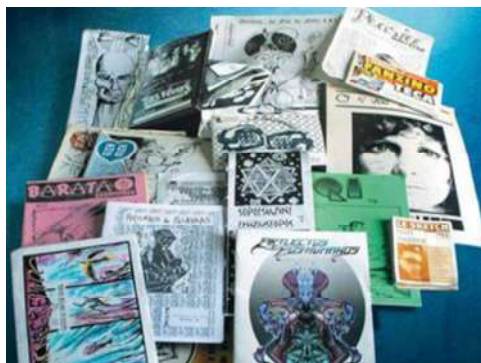
Figura 1 – Fanzines de vários temas e formatos

Nos textos que foram inseridos, junto a imagens em powerpoints (convertidas em pdfs para facilitar o acesso online), abrangei desde a teoria à prática, e propus, entre algumas atividades como principais, a realização de um minizine como treino, e ao final, um fanzine, que seria inserido numa galeria virtual especialmente preparada a que os alunos pudessem deixar fotos e/ou vídeos dos fanzines para apreciações mútuas.