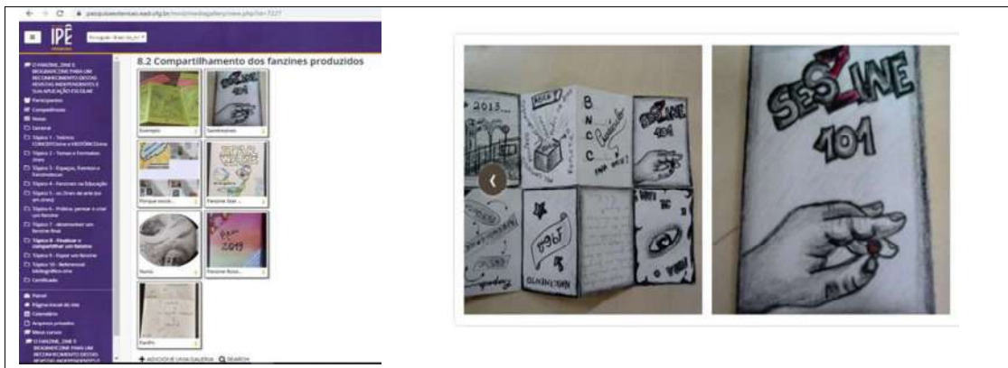
Figuras 6 a 8 – Na figura à esquerda, página principal da galeria com os fanzines dos alunos e no centro e à direita, imagens do fanzine final de Sandreli Nely