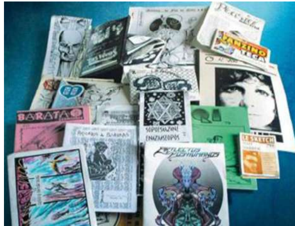
Figure 1 – Fanzines of various themes and formats