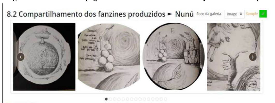
Figure 9 – Some of the pages of the final fanzine “Nunú” by Júlia Di D. Pupim