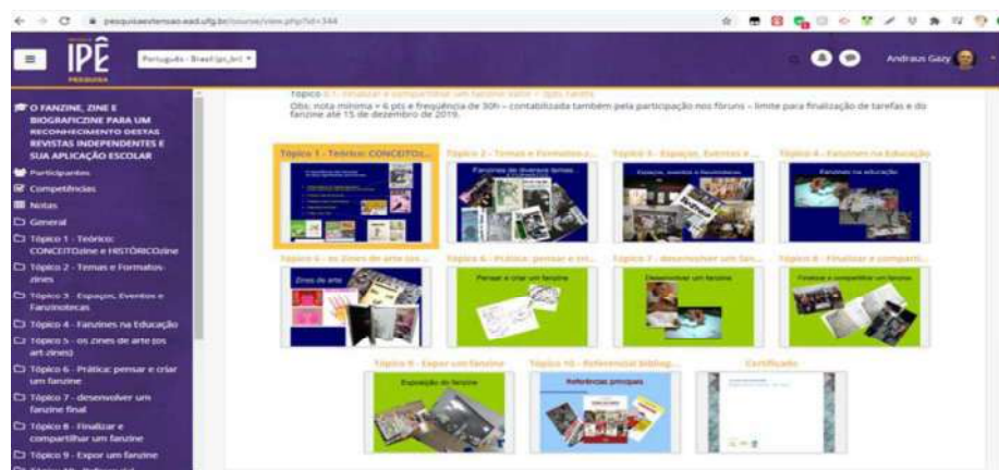
Figure 2 – Notice that the first 5 topics are on a dark blue background and the practical topics on a green background