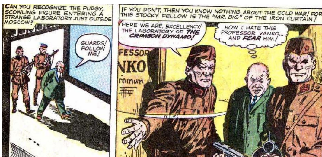
Figura 3 - Krushev, o “chefão” da cortina de ferro 5

Fonte: Tales Of Suspense nº46. New York: Marvel Comics, out. 1963. p.2