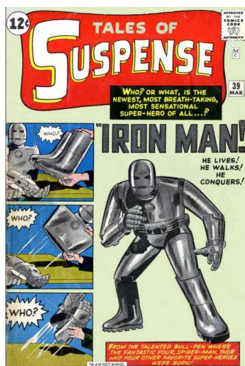
Figura 1 - Capa de estreia do Homem de Ferro

Fonte: Tales of Suspense nº 39. New York: Marvel Comics. Março de 1963.