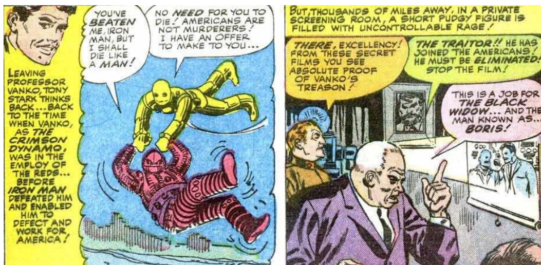
Figura 5 – Discurso de Stark e a ira do “rechonchudo” líder soviético 10