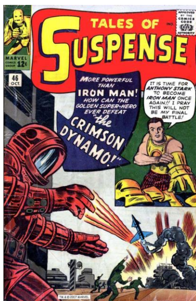
Capa de Tales of Suspense , nº 46, de outubro de 1963: