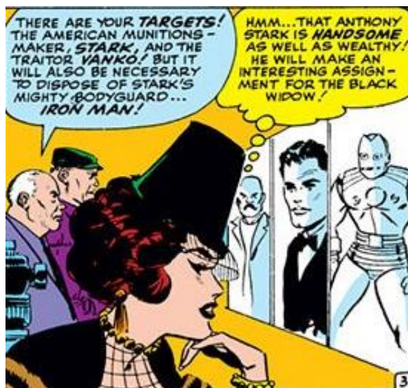
Figura 6 - Natasha Romanov, a Viúva Negra 11

Fonte: Tales of suspense nº 52. New York: Marvel Comics, abr. 1964, p. 03