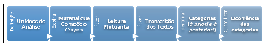
Figura 1: Percurso para realizar a AC.

Diante do esquema de Bardin (2011), seguimos, inicialmente, o percurso representado pela figura 1 (abaixo), a fim de criarmos as categorias de análise.