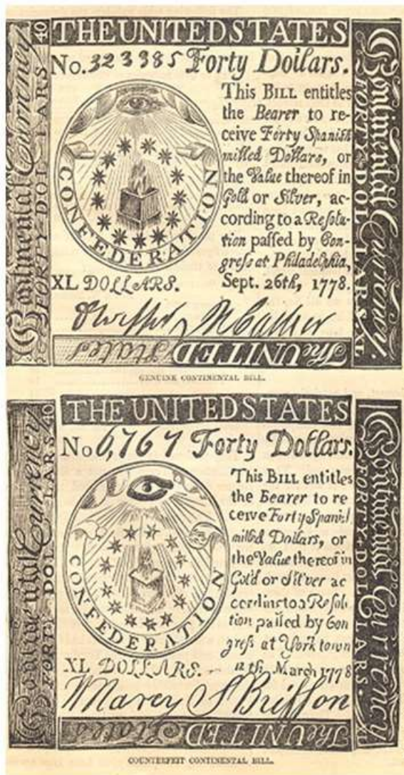
Imagem 6. Billetes de 40 dólares genuino y falso (1778)