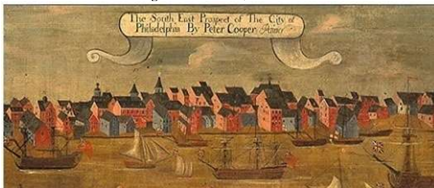
Imagen 2. Filadelfia, circa 1718

Numerosos informes de la época describen que el déficit comercial que las colonias mantenían con Gran Bretaña, se debía a una malversación de fondos constante de todo el metálico que cruzaba el Atlántico para pagar por artículos importados de lujo. Sin embargo, esta no fue la única causa de la desaparición de las divisas, ya que parte del dinero parece haber salido del continente como consecuencia del aumento de los precios de las mercancías en periodos de alta inflación. XI