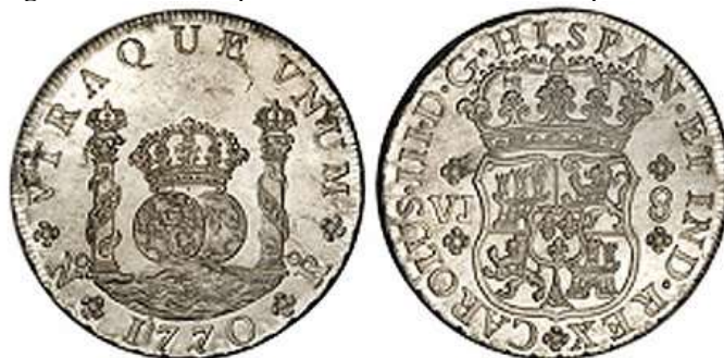
Imagen 3. Moneda española de 8 Reales llamada “Spanish Dollar”

Años más tarde, estas emisiones se tornaron excesivas, por lo que en 1727, la Corona británica tomó una serie de medidas disuasivas: se les pidió a los gobernadores que no firmasen series nuevas de las emisiones de Bill of Credit , al tiempo que se les solicitaba que gradualmente se retirasen las que estaban en circulación mientras se ordenaba que el pago de impuestos se realizase en metálico, estas medidas concluyeron con el Acta de Desmonetización de 1742. XX Se puede definir a este periodo como el de los planteamientos iniciales de la Revolución Norteamericana.