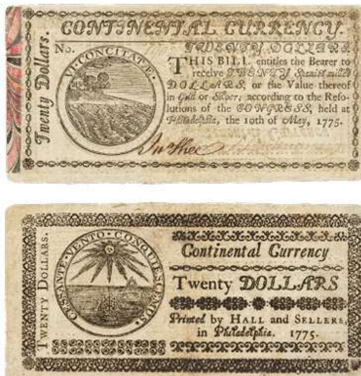
Imagem 4. Billete de 20 Continental Dollars (1775)

La Constitución que siguió a la Declaración de Independencia del 4 de julio de 1776 fue ratificada recién en marzo de 1781, los artículos de la Confederación no señalaban la existencia de un solo Estado sino de trece estados diferentes. No obstante, tanto estos estados como el Congreso Continental estaban facultados para establecer una ceca y emitir dinero. XLIV