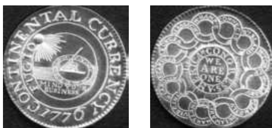
Imagem 5. Continental Currency Filadelfia, 1776

La moneda metálica fue acuñada en peltre, latón y plata, tratando de llegar a un equivalente del Spanish Milled Dollar , pero debido a la escasez de plata no se realizaron muchas emisiones. Simultáneamente, con la emisión de monedas en 1776 también se emitió moneda de papel debido a la escasez de plata que sufría parte del movimiento independentista que se había organizado en las trece colonias. El diseño de los billetes se corresponde con las características mencionadas en la pieza monetaria. L