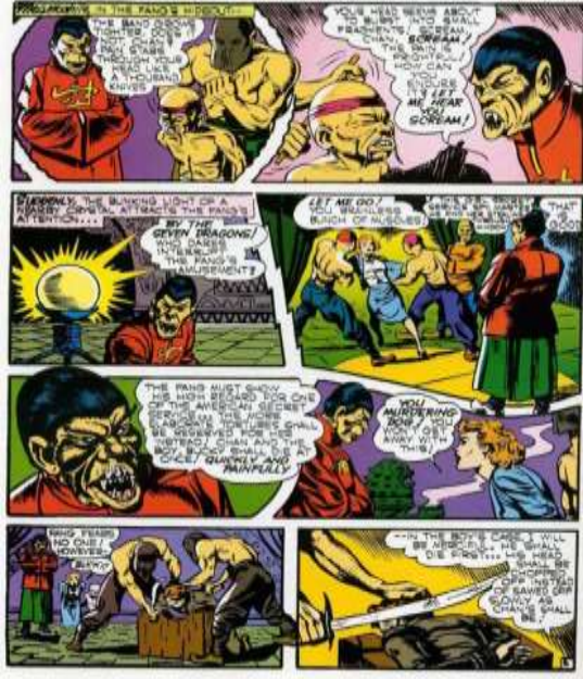
Figura 21. O perigo Asiático