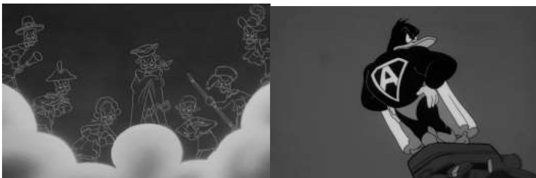
Figura 14. Personagens icônicos dos EUA no céu; Figura 15 - Patolino super-herói

Fonte: Cenas da animação Scrap Happy Daffy (1943)