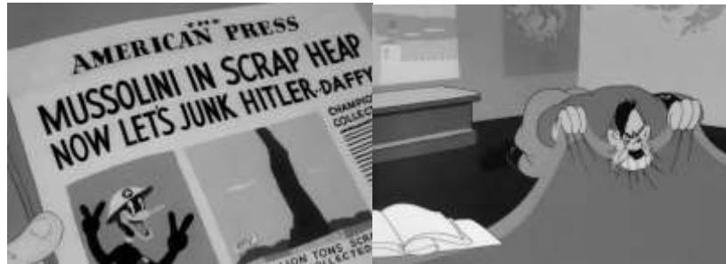
Figura 12. Desenho do jornal “Pato americano vence o exército de Mussolini com uma pilha de sucata”; Figura 13 - Hitler raivoso como um cachorro