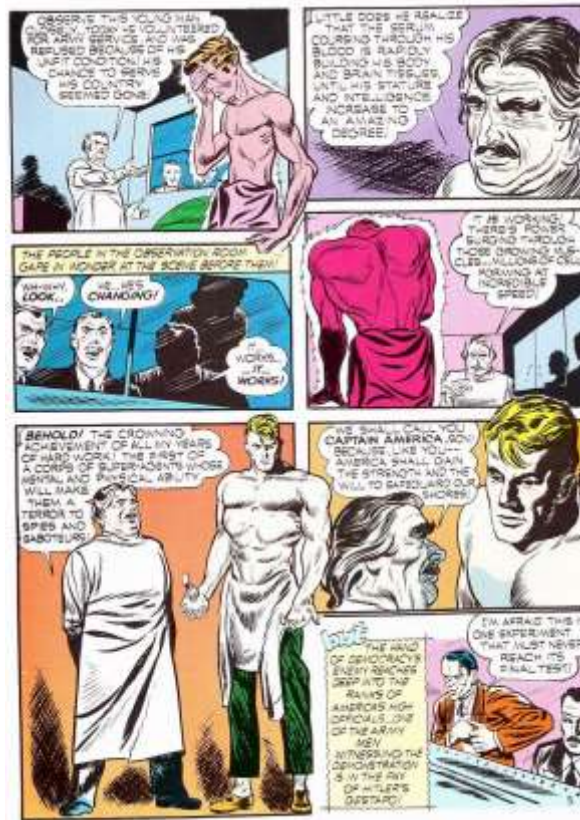
Figura 22. Metamorfose