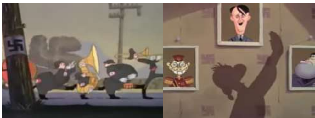
Figuras 1, 2, 3, 4 e 5. Pato Donald em NutziLand : O pesadelo nazista

A primeira era estrelada pelo Pato Donald e foi premiada pelo Oscar como a animação do ano. Nela, Pato Donald acorda em uma terra chamada NutziLand (um trocadilho com a palavra nut , que significa “louco”, e com a forma de pronunciar Nazi no inglês). Essa terra era cercada de suásticas nazistas em todos os locais - nos postes da cidade, nas decorações das casas, no pássaro cuco de Donald; uma banda marcial marcha pelas cidades exaltando o Fuehrer . Na casa em que Donald mora, ele é obrigado a comer pão duro, ler trechos do livro de Adolf Hitler Mein Kampf pela manhã e a todo momento deve prestar continência ao ditador ao ver uma imagem sua. Imaginando não estar sendo vigiado, Donald pega um grão de café escondido de seu cofre e passa em uma xícara de água quente para tentar sentir o gosto do café. Ele também borriça em sua boca um aroma de bacon e ovos. A Alemanha Nazista é representada nessa animação como uma terra que, além de pobre por não conter produtos básicos para a alimentação, inibe o prazer do sujeito, tornando-o um mero adorador do estado. De fato, a propaganda que enaltece o líder da nação é uma das características marcantes dos governos fascistas, além da busca por cerceamento das liberdades individuais, também demonstrada na animação pelo medo constante de vigilância no personagem durante seu café da manhã.