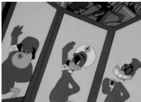
Figura 11. O Eixo retratado a partir de personagens