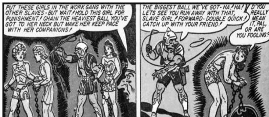
Figura 27. Mulher Maravilha acorrentada

Fonte: Retirado de: LEPORE, Op. Cit. , p.90