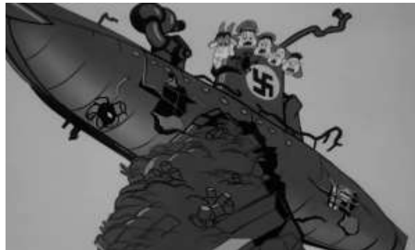
Figura 16. navio do Eixo em pedaços

Fonte: Cena da animação Scrap Happy Daffy (1943)